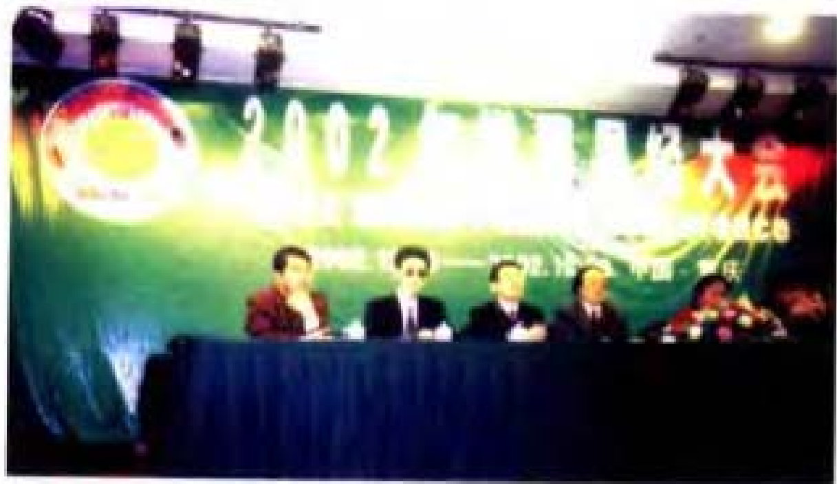
▲ 2002年作者在重庆涪陵区人民政府、南京大学易学研究所等单位举办的世界易经大会主席台上宣讲学术论文。