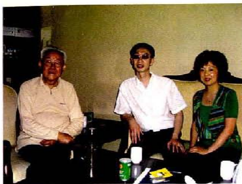
作者与中国文学艺术界联合会委员、 中国美术家协会理事、 中国画研究院院务委员、博士生导师、 湖北省文学艺术界联合会执行主席 周韶华教授（左一）， 重庆市东方周易文化研究院副院长 任小渠老师（右一）合影。