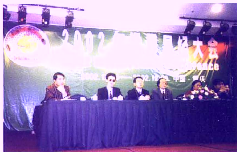
作者于二00二年在重庆涪陵区人民政府、 南京大学易学研究所等单位举办的 世界易经大会主席台上宣讲学术论文。