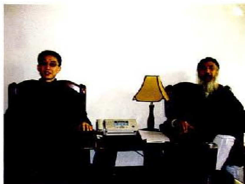
作者与中国道教协会会长、全国道教委员、 中国民族宗教事务委员会副委员 任法融先生（右）合影。